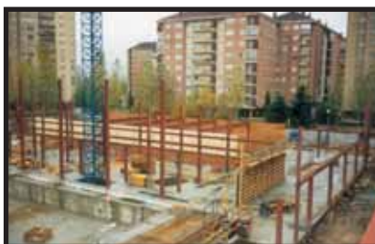
Centro Cívico Lakua

Montaje de estructura metálica del polideportivo de Sansomendi.