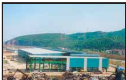
Naves nuevas de Celsa

Montaje de nuevas naves de fundición y ampliación de naves antiguas.