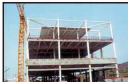
C.C. Y MULTICINES ISLA DE LA PALMA