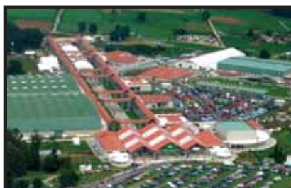
Recinto ferial Semana Verde de Galicia (Silleda)

Montaje de estructura metálica pabellones A, B y C.