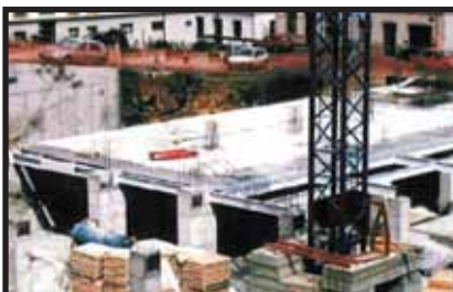
C.C. Y VIVIENDAS ISLA DE LA PALMA