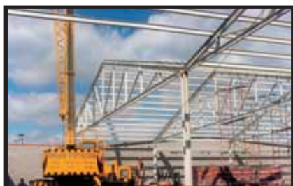
Almacén Zara - Grupo Inditex

Montaje de estructura metálica galbanizada en Arteixo.