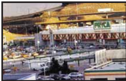
C.C. PRYCA VIZCAYA