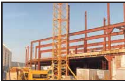
TOYSR'US A CORUÑA